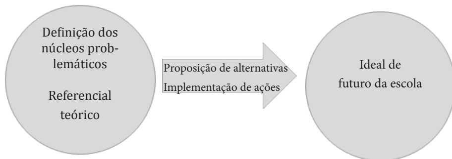
Figura 01 – Construção do PPP da escola

Na figura a seguir, ilustramos a reflexão que a escola terá que fazer no momento de construção do seu PPP: