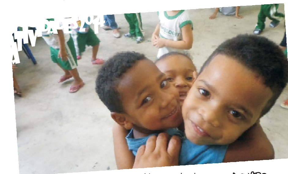
Um grande abraço, A EQUIPE

No dia 08 de novembro foi realizado o XVI Encontro Estadual de Educadores/as em Direitos Humanos, em Mesquita. Agradecemos a parceria com a Secretaria Municipal de Educação de Mesquita e a participação de tod@s. Na ocasião, foi anunciado o lema que orientará o ciclo de formação em 2015: Famílias e Escola: promover o diálogo, construir parcerias.